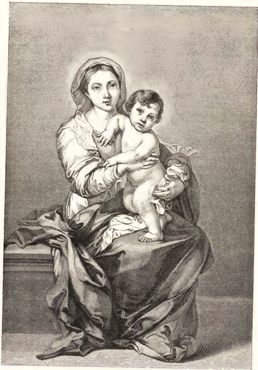
LA VIERGE ET L'ENFANT JÉSUS. (Musée de Madrid.)